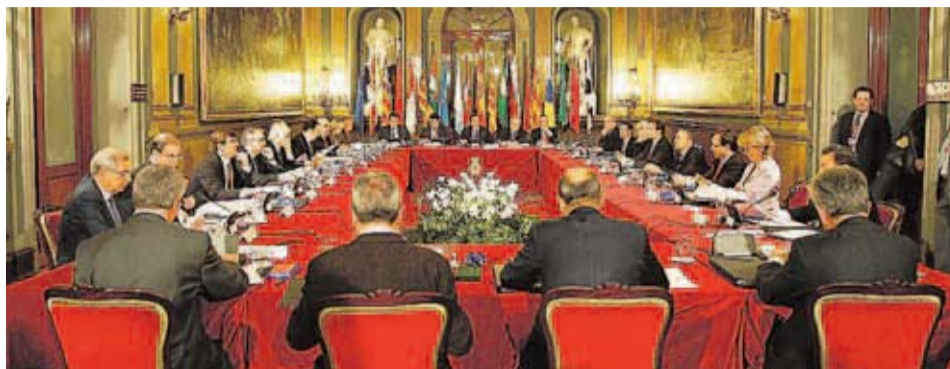
La última cumbre de presidentes de CC AA fue en 2009.