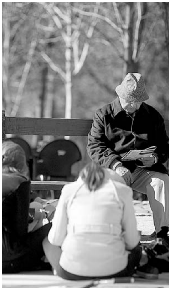
Un jubilado leyendo en un parque en Madrid. PABLO MONGE

De ahí que desde el Banco de España u otras instancias como el think tank Fedea hayan advertido públicamente esta semana que la revalorización de las pensiones obligaría al Gobierno a incumplir el objetivo de déficit para 2012 fijado en el 6,3% por Bruselas. Ante esta