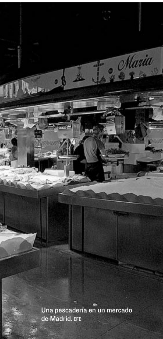
Una pescadería en un mercado de Madrid.

Este indicador llama también la atención sobre el hecho de que cada vez sean menos las empresas que permanecen inscritas y, a la vez, aumentan su plantilla (la caída interanual de estas compañías se acelera en agosto y roza el 8% interanual).