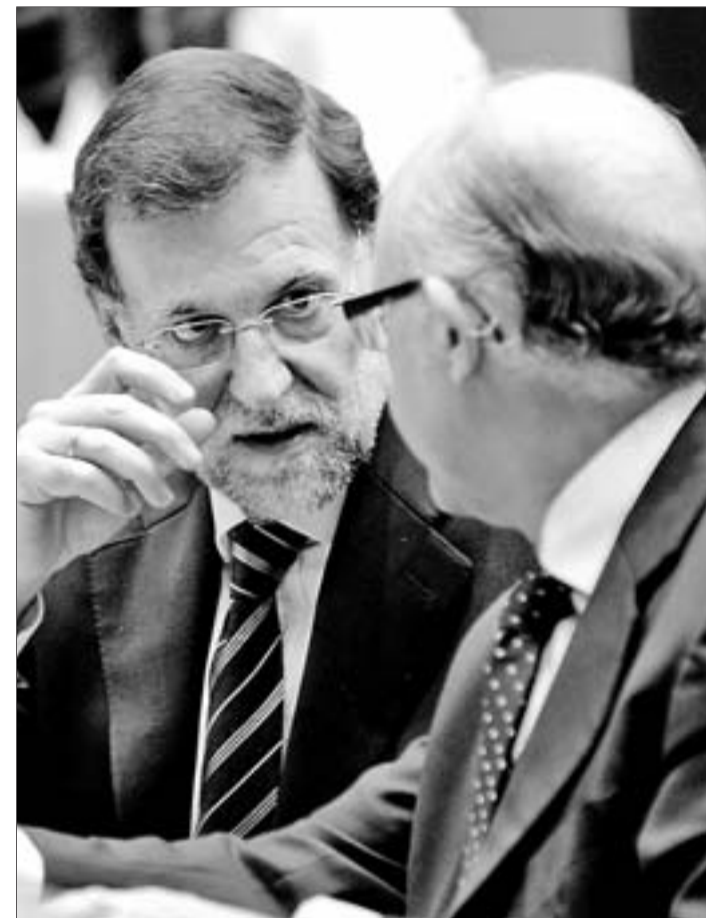
El presidente del Ejecutivo, Mariano Rajoy, conversa con el ministro de Hacienda, Cristóbal Montoro.

Al mismo tiempo que está elaborando unos Presupuestos Generales del Estado en los que se contemplan recortes del gasto de hasta el 40%, el Ejecutivo también baraja la posibilidad de que, pese a sus esfuerzos titánicos, no consiga llegar al 6,3% a finales de año. Eso le obligaría a tener que retratar-se ante unas autoridades comunitarias que ya amonestaron a Zapatero muy seriamente por cerrar 2011 con un desfase entre ingresos y gastos de un 8,5% y que ahora, si finalmente se confirma ese desvío, podrían obligar al Ejecutivo a asumir nuevos compromisos, bien a través de subidas de impuestos (algo difícil teniendo en cuenta que ya ha subido IRPF o IVA y ha eliminado beneficios de Sociedades) o de recortes de gasto. ¿Cuáles serían las partidas que más ingresos podría reportar a corto plazo? Estas son algunas de las opciones que están encima de la mesa de Hacienda.