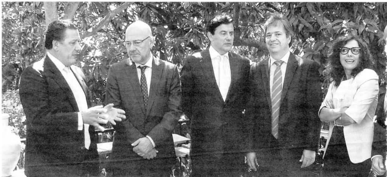
Los asistentes al debate coincidieron en el papel de las nuevas tecnologías como base de la formación.