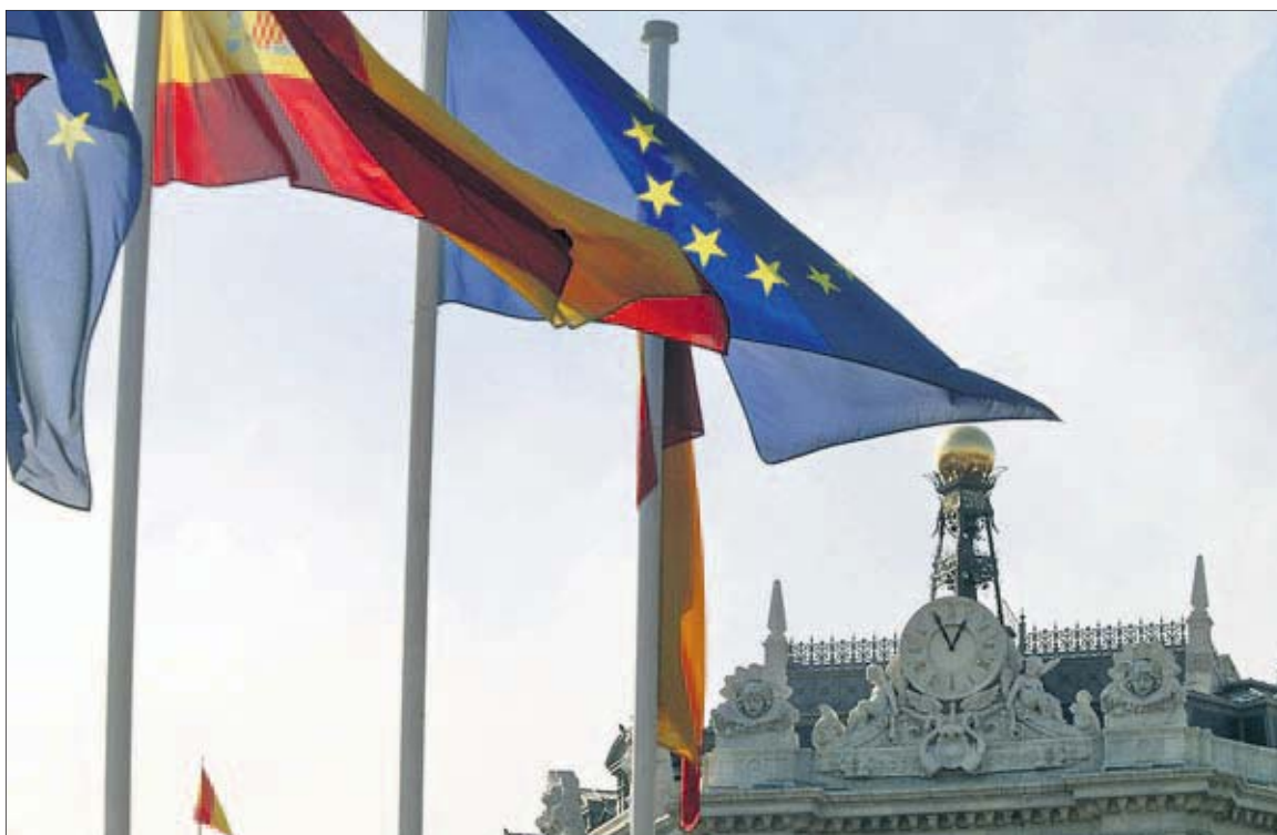
Sede del Banco de España, en Madrid.

Del lado de la carga inmobiliaria, lo que está pendiente es acotar el precio al que el banco malo , la sociedad de gestión de activos, comprará el ladrillo a las entidades intervenidas. Desde Economía se ha sugerido que el descuento será equivalente al esfuerzo en provisiones al que ha obligado el Gobierno en sus últimos decretos: 80% para suelo, 65% para promociones sin terminar y 35% para vivienda acabada. Fuentes financieras apuntan, no obstante, a que dicha valo-