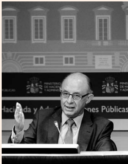
El ministro de Hacienda, Cristóbal Montoro.

También descendieron con fuerza: de 8.077 a 6.345. Un 21% menos en sólo un año. Es