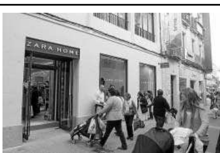
Tienda de Zara Home en Córdoba.