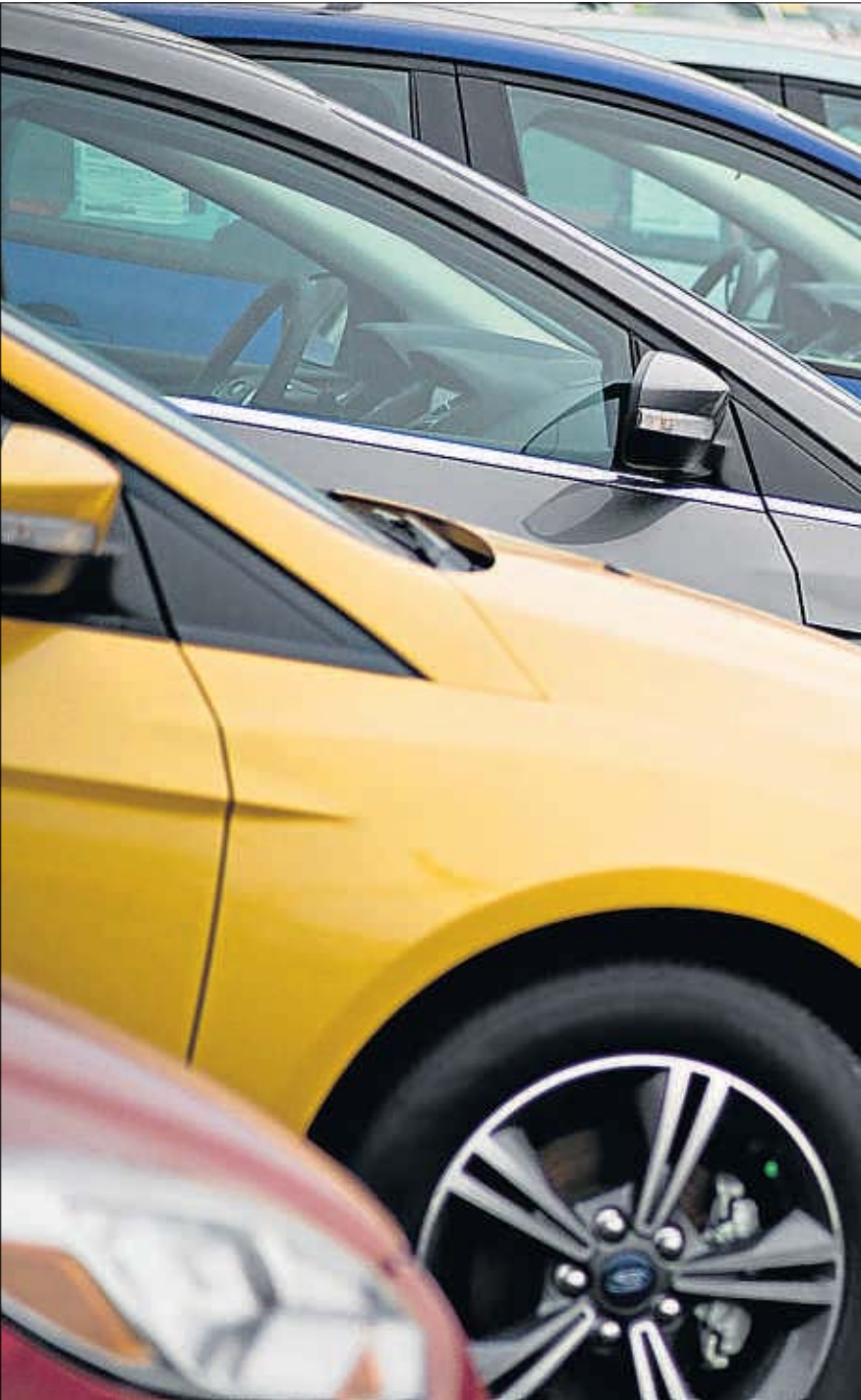
El IVA subirá el precio del coche, la gasolina, los repuestos, mantenimiento, seguros...

En opinión de Lorenzo Dávila, profesor del Instituto de Estudios Bursátiles, “en términos de subida de precio el impacto va a